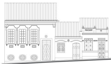
Desenho de restituição das fachadas Autora: Larissa Nascimento Antunes (2016)