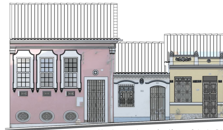
Vetorização sobre ortofoto (Carmo, Salvador-BA)